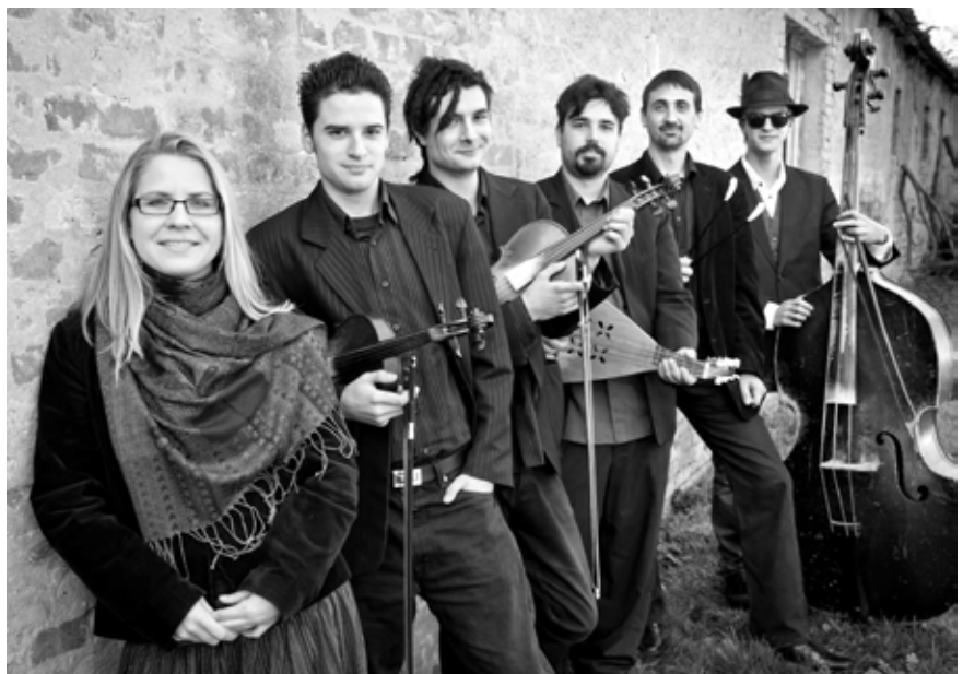
A Köztársaság Bandája