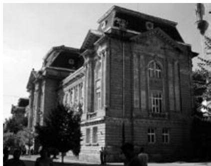
II. Rákóczi Ferenc Kárpátaljai Magyar Főiskola

A szervezetek bevétel 26 602 000 hrvnyva, ebből az állami támogatás 3 853 000 hrvnyát tett ki, de állami támogatást a pártok