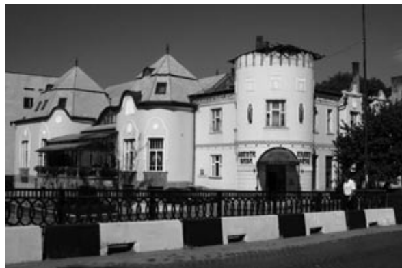
Arany Páva Szálloda

Ukrajna függetlenné válása (1991) után rohamosan növekedett a civilek száma.